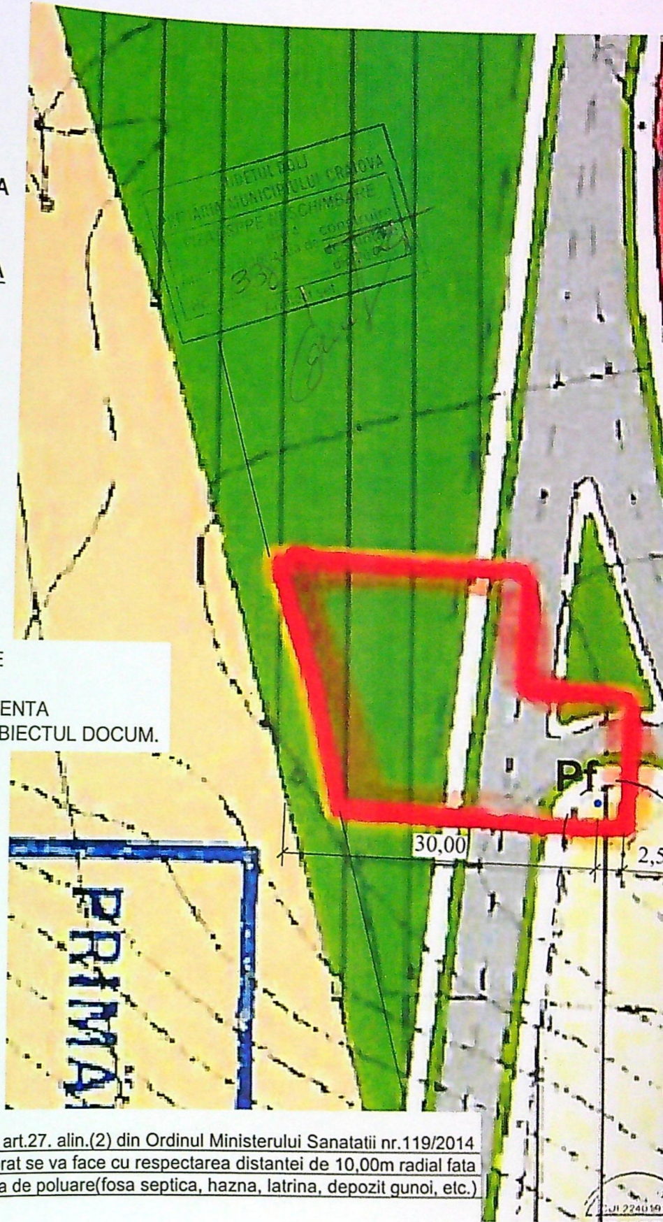
PLAN DE INCADRARE IN P.U.Z.

NOTA: Conform prevederilor art.27. alin.(2) din Ordinul Ministerului Sanatatii nr.119/2014 amplasarea putului forat se va face cu respectarea distantei de 10,00m radial fata de orice sursa posibila de poluare(fosa septica, hazna, latrina, depozit gunoi, etc.)